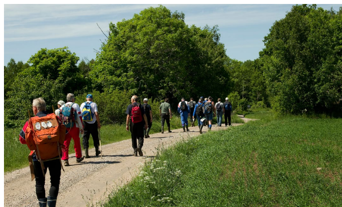
Bilder från fjolårets premiärvandring.